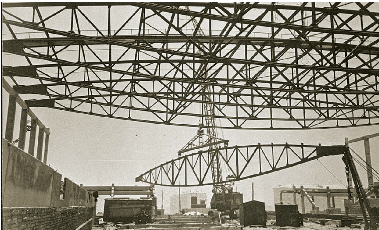
Строительство Дворца спорта на улице Р. Зорге. 1967 г.